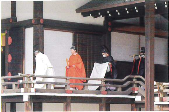
賢所皇霊殿神殿に謁するの儀 令和2年11月8日

秋篠宮文仁親王殿下が皇嗣になられたことを、天皇陛下が国内外に広く宣明になられる「立皇嗣宣明の儀」が十一月八日午前十一時に皇居で執り行われました。鶴戸神社では十時より「立皇嗣の礼当日神社に於て行ふ祭祀」を齋行、ご祭神にその旨をご奉告致しました。なおその後、皇嗣となられた殿下は、「賢所皇霊殿神殿に謁するの儀」と、天皇・皇后両陛下にお礼申し上げます。「朝見の儀」に臨まれました。