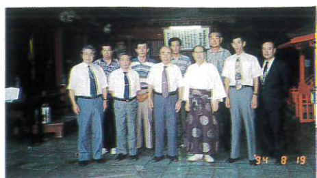
福岡県神社庁糸島支部