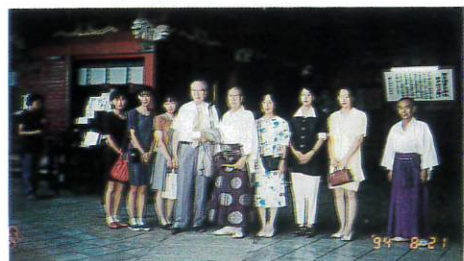
諏訪神社宮司 上杉氏