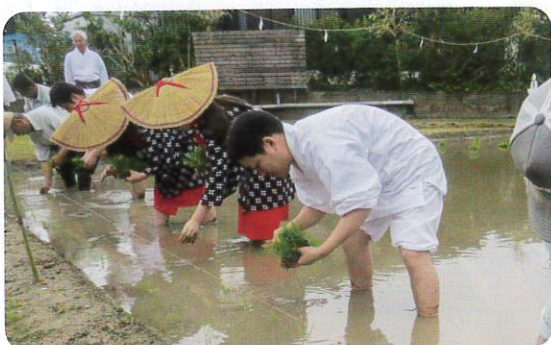
御田植祭 令和2年3月19日

翌月9日には、地区の皇子神社で、鶺鴒地区にある御神田を祓い清める「清祓祭」を斎行しました。同月19日に「御田植祭」を斎行しました。