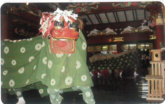
鶺鴒さん獅子舞 令和2年3月28日

この鶺鴒さん獅子舞は、昭和55年の御神幸祭を最後に舞われなくなっていたものを、平成11年2月に鶺鴒地区の氏子より鶺鴒神宮神職等に