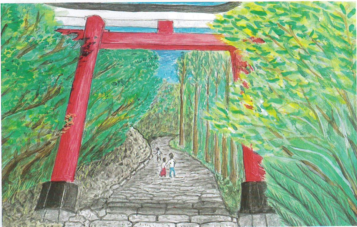
「八丁坂」 作画：鵜戸神宮権禰宣 刈田賢二

幸ひ経費については、地区募財を実施し、また幾ばくかの蓄へもあるとのことでした。さらに、足