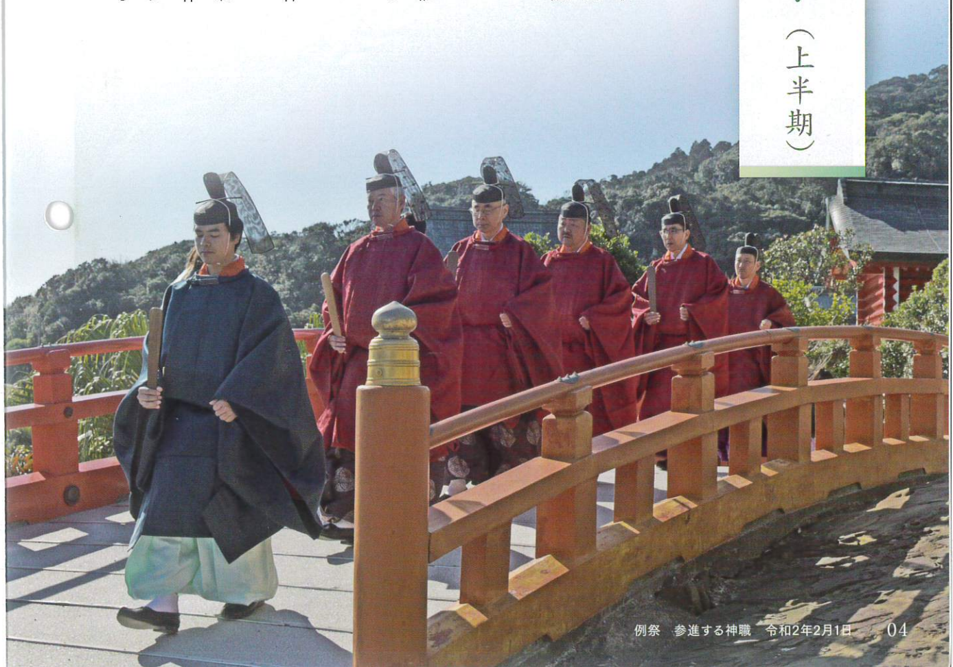
例祭 参進する神職 令和2年2月1日 04

2月9日には、「剣法発祥第67回鶺鴒山顕彰剣道大会」が儀式殿前広場にて開催されました。県内外から団体171チーム、個人89名が出場し、若い剣士たちによる熱戦が繰り広げられました。